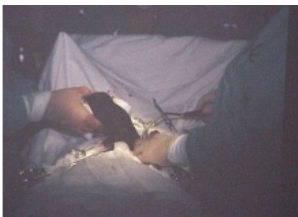
Figura 3.- Gastrotomía: Parto del bezoar.

El postoperatorio fue satisfactorio y sin complicaciones al alta.