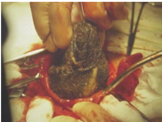
Figura 2.- Gastrotomía: El tricobezoar ocupa toda la cavidad gástrica.

En la evolución, la paciente cursó con cuadro de oclusión intestinal. Fue sometida a una laparotomía con gastrotomía (Figura 2) y extracción de un cuerpo extraño de color negro brillante, fétido, de 30 x 15 x 10 cm, que pesó 1800 g (Figuras 3 y 4).