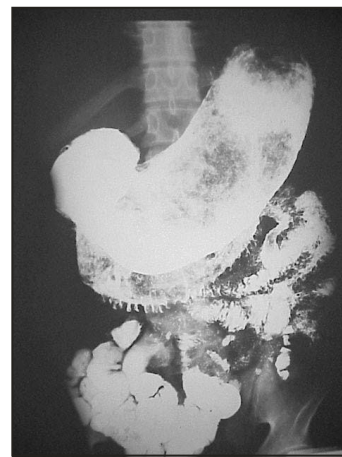
Figura 1.- Serie gastroduodenal mostrando defecto de relleno.

La endoscopia gástrica mostró concreción de cabellos y moco que ocupaba casi todo el lumen del estómago.